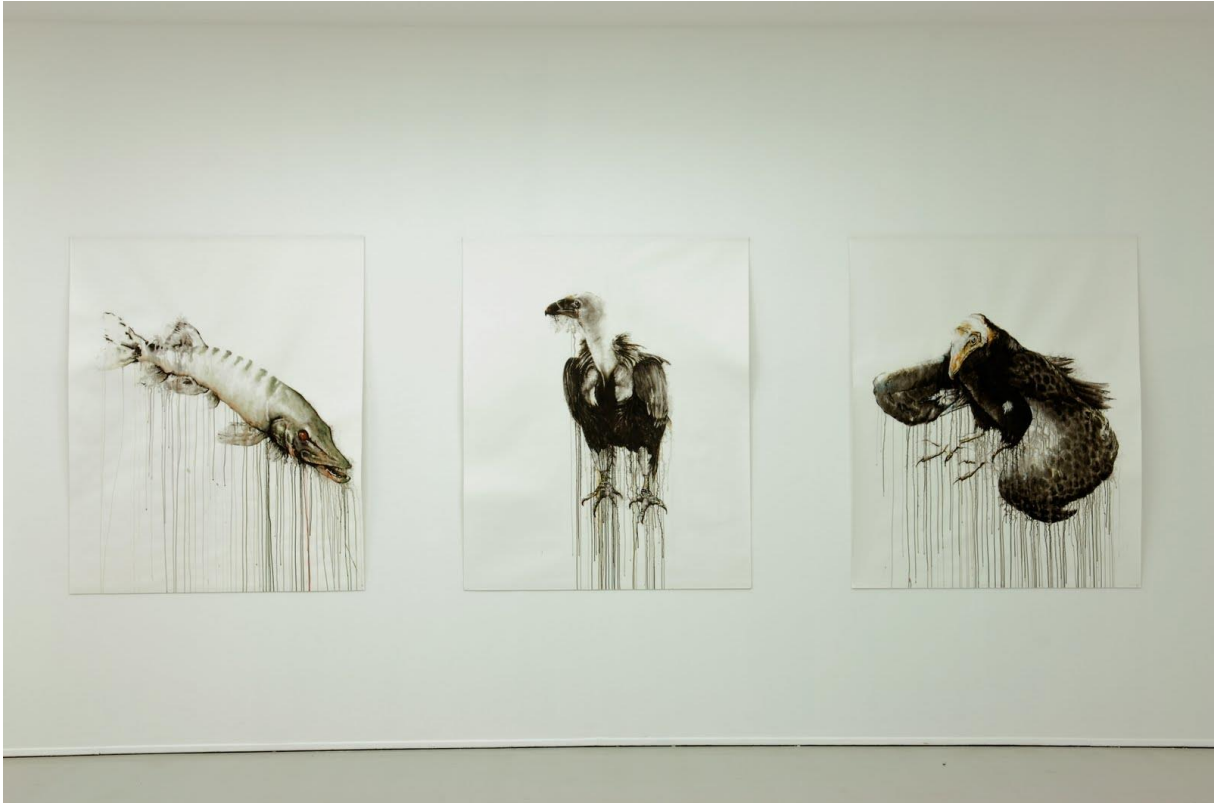
Musée d'Art Moderne et Contemporain de Saint-Etienne (février-avril 2010)