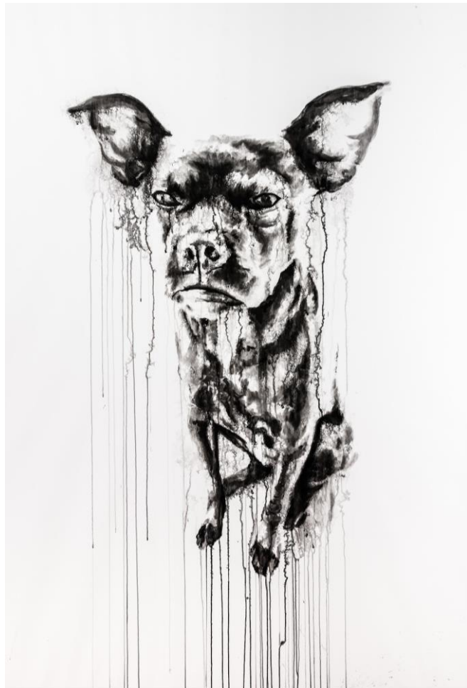
« Chien », encre sur papier