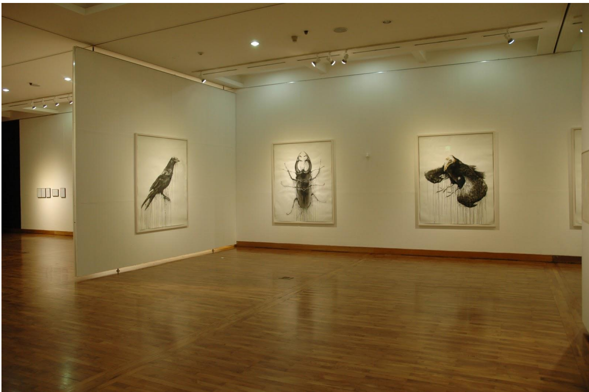
Musée d'Art de Daejeon – Corée du Sud (mai-juin 2011)