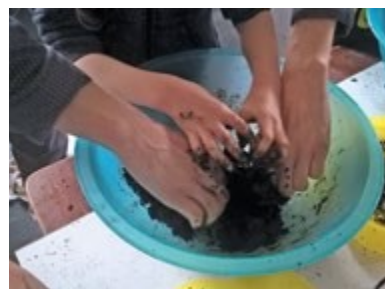
Atelier bombes à graines

C'est parfois une passion, ou un continent complètement inconnu. La bibliothèque ouvre la porte de tous les savoirs, et de tous les possibles. Comprendre que l'informatique, ce n'est pas magique, mais que derrière un jeu vidéo, ce sont des femmes et des hommes qui programment les actions de l'ordinateur, et apprendre dès le plus jeune âge aux enfants le code dans des ateliers