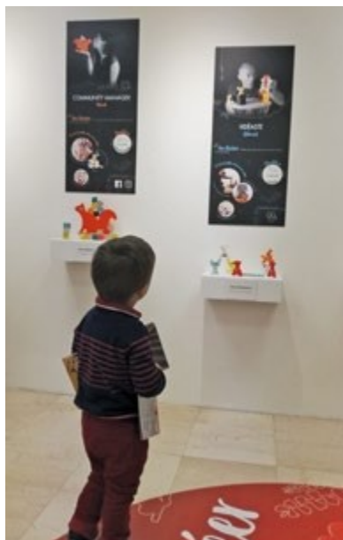
Expo Tu joues ou tu joues pas ? décembre 2018