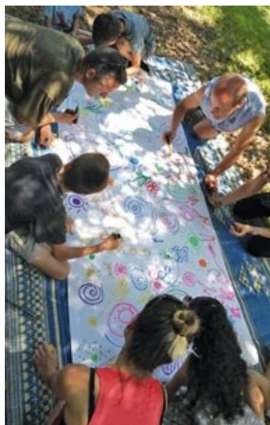
Dialogues en humanité, 2019