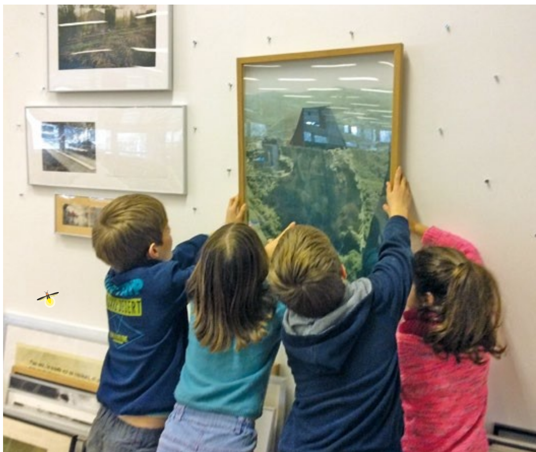
Club des bibliothécaires juniors, 2017